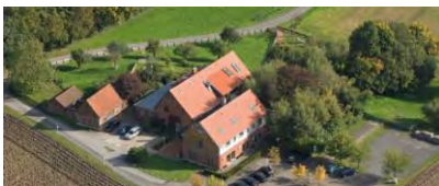
Landgasthof Hohen Hagen Hoest 28 in 59320 Ennigerloh